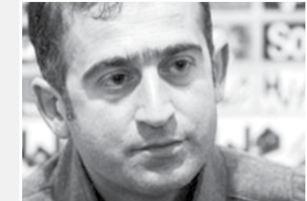
سکوها مشاهده شود. وی افزود: "مدیرعامل و کانون هواداران باشگاهها باید سکوهایی ورزشگاهها را کنترل کند و تماشاگران حق دارند تا تیم خودشان را تشویق کنند اما حق توهین به تیم مقابل اعم از سرمربی، بازیکنان و حتی هواداران رقیب را ندارند. البته سکوی ورزشگاه جای هیاهو و هورا کشیدن است و نباید تبدیل به آرامش حاکم بر کلاس درس شود"